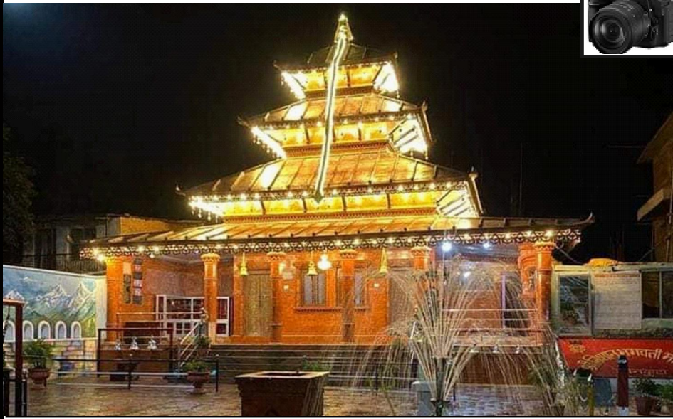
आकर्षक बन्दै निशान देवी मन्दिर : नेपाली सेनाको पहल र स्थानीयवासीको सहकार्यमा निशान देवी मन्दिरमा तामाको छाना र तेलिया इट्टा लगाईएपछि मन्दिर थप सुन्दर र आकर्षक बनेको छ ।